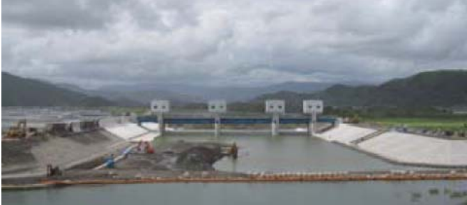
(上流部の十文字堰工事)