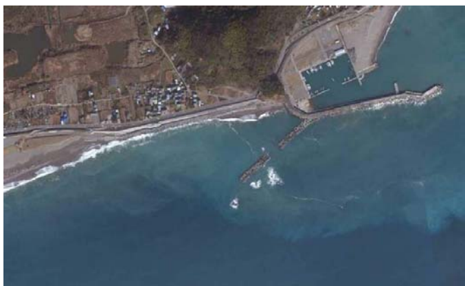
仁ノ海岸離岸堤工事