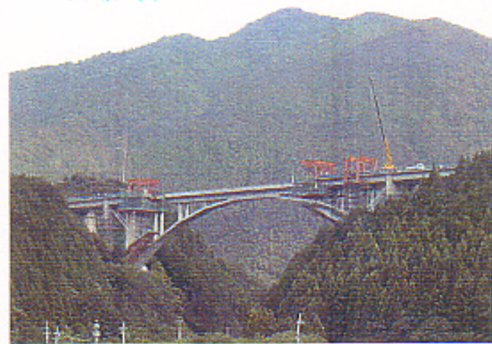
天子川橋（コンクリート逆ランガーアーチ橋）