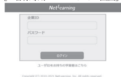
[お客様専用ページログイン画面]