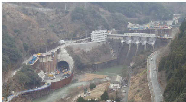
鹿野川ダム改造事業 現場状況