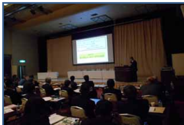
四国の生コンについて語ろう 趣旨説明：橋本親典 (徳島大学)