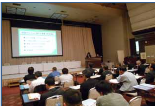
四国の生コンに関する現状調査報告 新居宏美 (香川県生コンクリート工業組合)