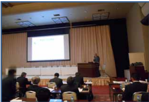
四国の生コンにおける フライアッシュ利用への取り組み 石井光裕(石井技術士事務所)