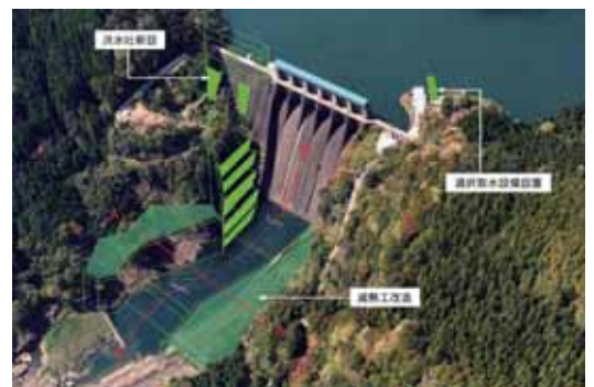
長安口ダム 改造事業計画